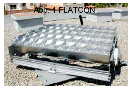
Abb.3 Sol3G [1]