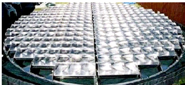
Abb.2 Pyron [1]